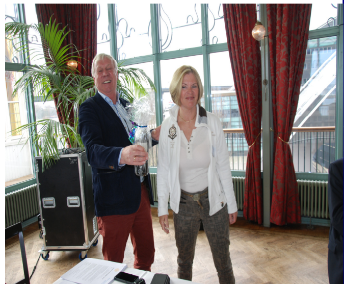
(tekst van Arie en Slppo)